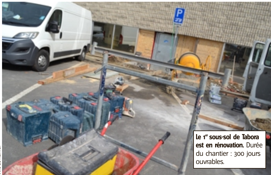
Le 1 er sous-sol de Tabora est en rénovation. Durée du chantier : 300 jours ouvrables.

Pour la Ville de Namur, c'est surtout la concrétisation d'un dossier qui est arrivé sur la table du conseil communal en 2014. La course aura duré 5 ans. Et les autorités communales voient, enfin, la ligne d'arrivée. Un véritable marathon semé de nombreuses embûches. « la Région wallonne, via Infraspports, avait émis plusieurs remarques : elles portaient notamment sur des modifications techniques au niveau des vestiaires, de l'ascenseur et d'emplacements de parking. Toutes les remarques ont, depuis, été intégrées au