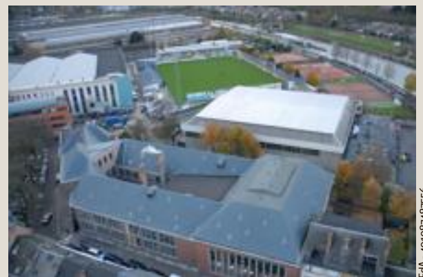
Les travaux de Tabora dureront, au maximum, 300 jours ouvrables. Les salles seront toujours accessibles.